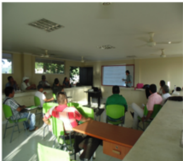
Tierra Alta, Cordoba

Con aportes de todos ellos se plantea un Modelo de Atención el cuál será piloteado en estos tres territorios